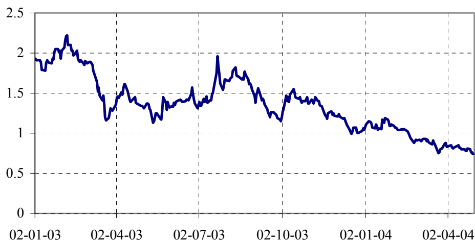
Πορεία Τιμής Μετοχής (01/01/03 - 30/04/04)

Στο ακόλουθο διάγραμμα παρουσιάζεται η πορεία της τιμής της μετοχής της Εταιρίας για την περίοδο 01.01.2003 έως και τις 30.04.2004: